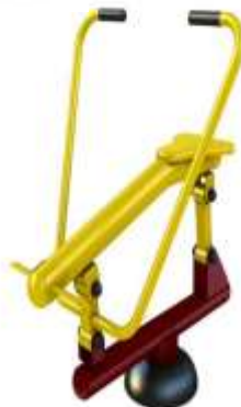
MÁQUINA TIPO REMO