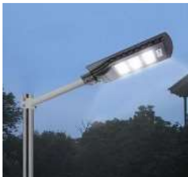
EJEMPLO DE LÁMPARA A UTILIZAR